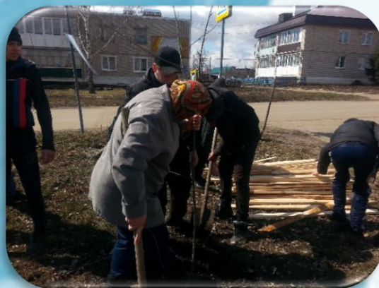
Посадка деревьев на аллее «Славы»