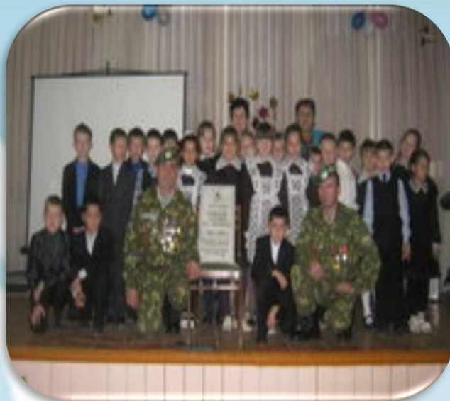
Встречи с участниками боевых действий