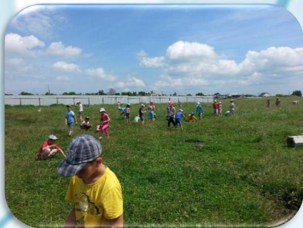
Сбор лекарственных трав