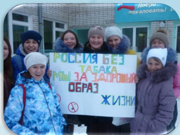
Акция «Россия без табака»