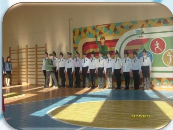
Смотр строя и песни