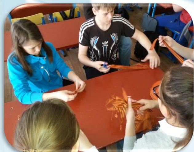
Акция «Георгиевская лента»