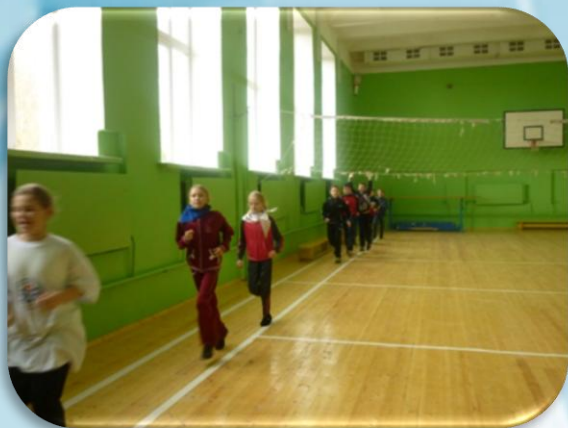
Акция «Здоровая пробежка»