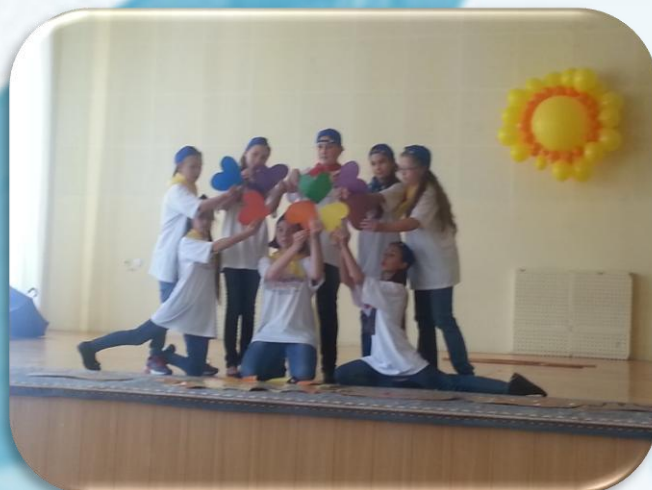
Агитбригада по профилактике асоциальных явлений «Свежий ветер»