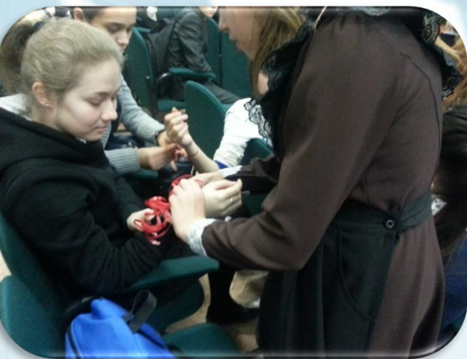
Акция «Количество свечек зависит от тебя»